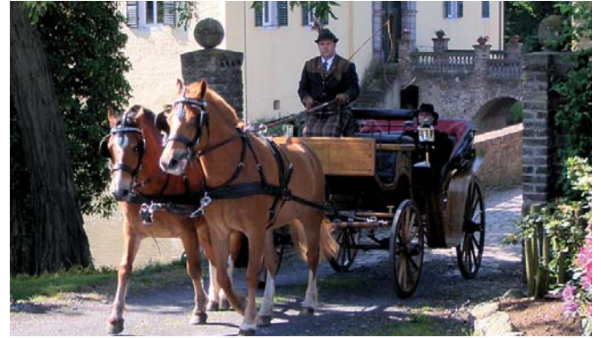
Schöne alte Kutschen werden auf der Burgenfahrt zu sehen sein.